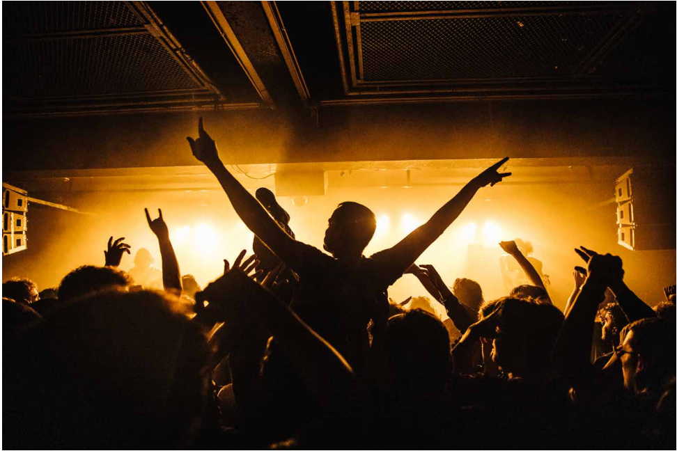
TRIX – SONS