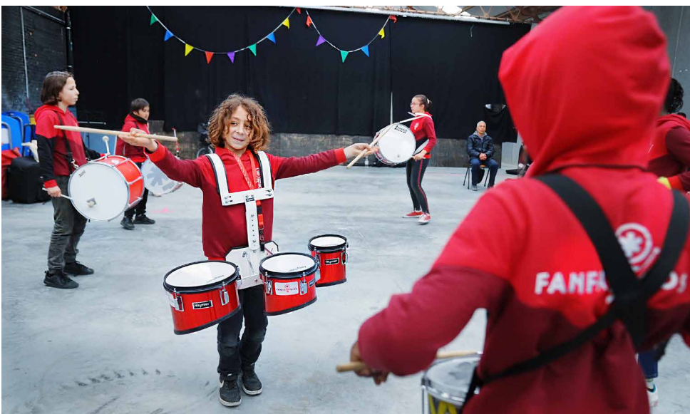
MetX – Fanfakids – © Iwona Pom

Als sector verbinden we artistiek ondernemerschap met sociale duurzaamheid door maatschappelijk verantwoord te ondernemen. Tegelijk reiken we de hand naar de sociale partners en de overheid om samen te blijven investeren in de sector, door middel van de VIA-akkoorden, en om de regelgevende kaders en ondersteuningsmaatregelen beter af te stemmen op de realiteit in de sector.