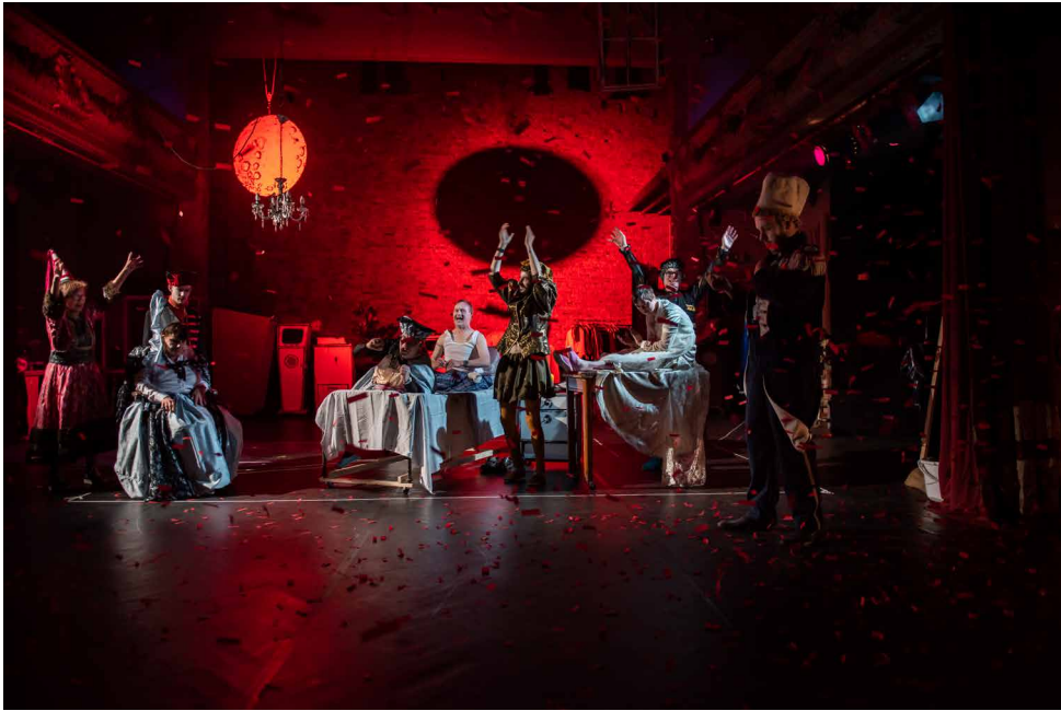
Abattoir Fermé, Nona, Sjarabang – NORMALIZERS

Beleidsmakers op alle niveaus hebben vele kaarten in handen om onze kunsten te laten bloeien. Afstemming en overleg is noodzakelijk: onder de beleidsniveaus en met de sector. Want afgestemd beleid is beter beleid.