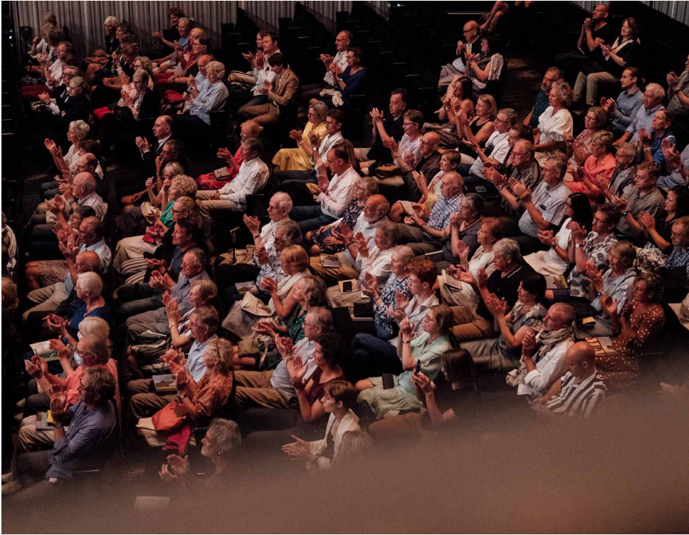
MA Festival