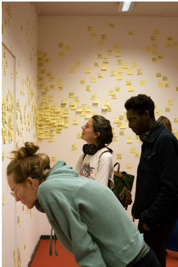
Tristero – Fluisterbehang – © Liza Vandenbempt