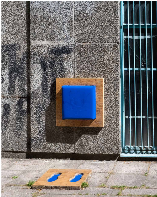
Damaged Goods – 17 movements – Decorateller – © Enzo Smit's