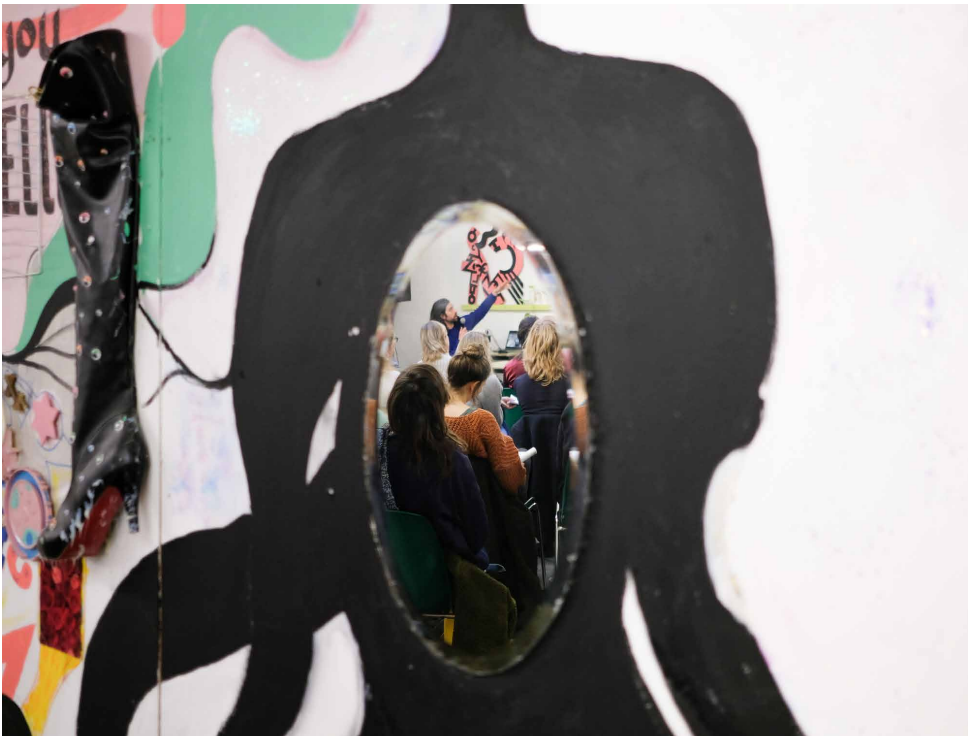
Globe Aroma

Ook de beschikbare beleidsinstrumenten om verduurzaming te stimuleren, zijn vaak te weinig gekend, ontoereikend of onzeker. Wie subsidies wil aanvragen op dit domein, staat voor een te complexe en technische opdracht. Voor duurzame mobiliteit is de sector bovendien afhankelijk van derden, zoals het openbaar vervoer.