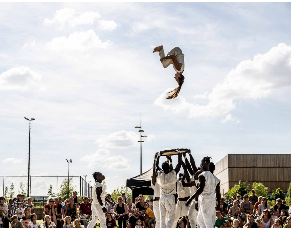
Zomer van Antwerpen – FA – Amoukanama