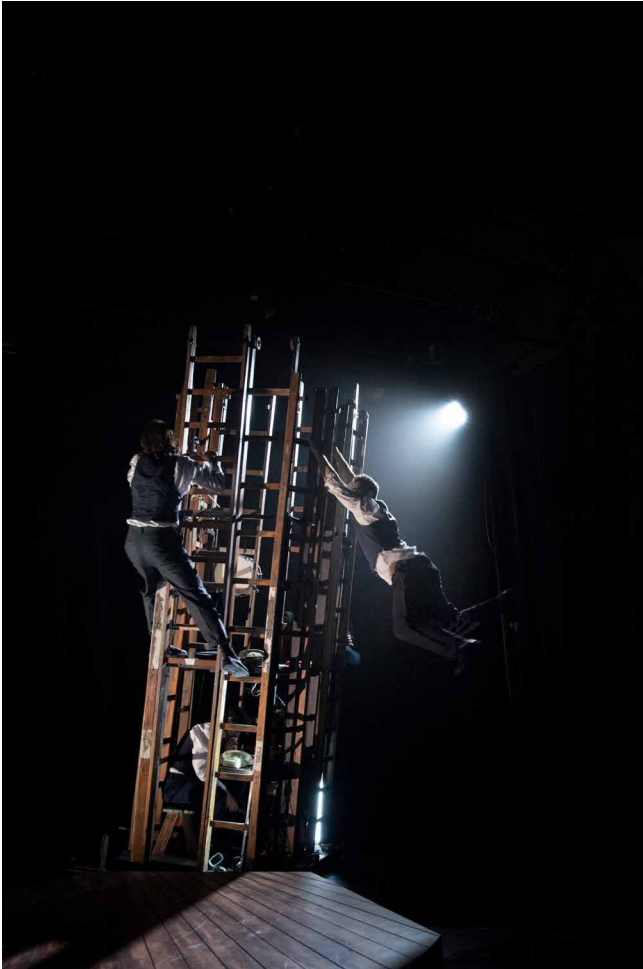
Lalka, hepaleis – Michal Gejzen