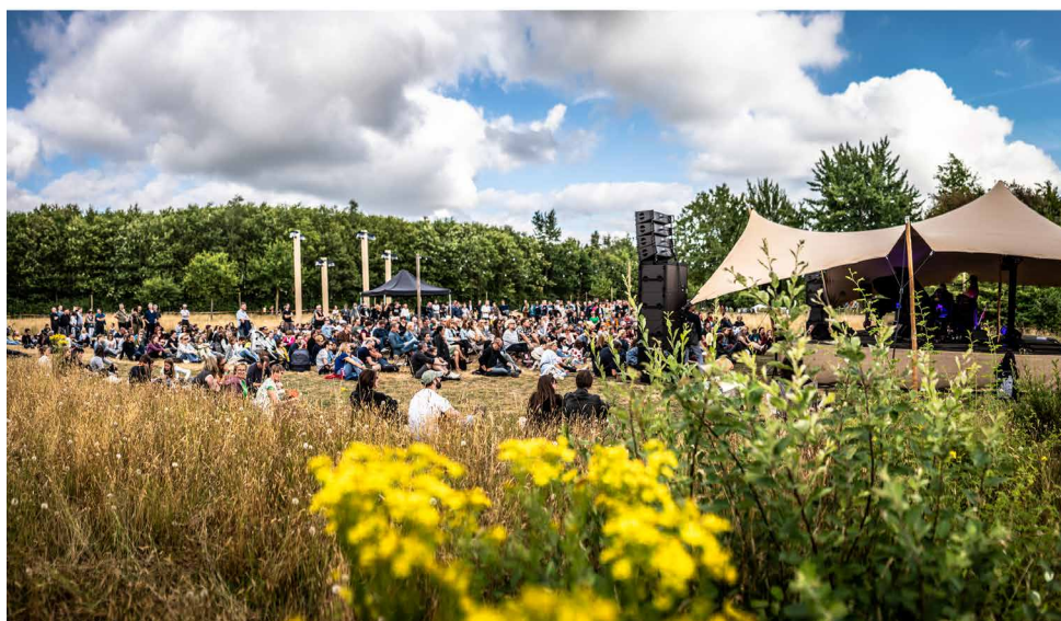
Wilde Westen – Bos Festival

Zonder sterke internationale samenwerking verzwakken we onze sector dus. Maar die samenwerking komt niet vanzelf. Buitenlandse partners stellen steviger eisen dan ooit, middelen zijn schaarser, de competitie groter. Ook onze ambitie om de zichtbaarheid van de Vlaamse kunsten in het buitenland te versterken stuit op moeilijkheden. De planlast is hoog en de regelgevende kaders zijn weinig transparant en slecht op elkaar afgestemd. De huidige ondersteuning, via subsidies en de bovenbouw, sluit niet altijd aan op onze uitdagingen en moeilijkheden. Hetzelfde geldt voor het overheidsgeïnitieerd stimulansbeleid. Om onze internationale positie te behouden én te versterken is er nood aan een aanpassing van de ondersteuningsmechanismen en van het regelgevend kader.