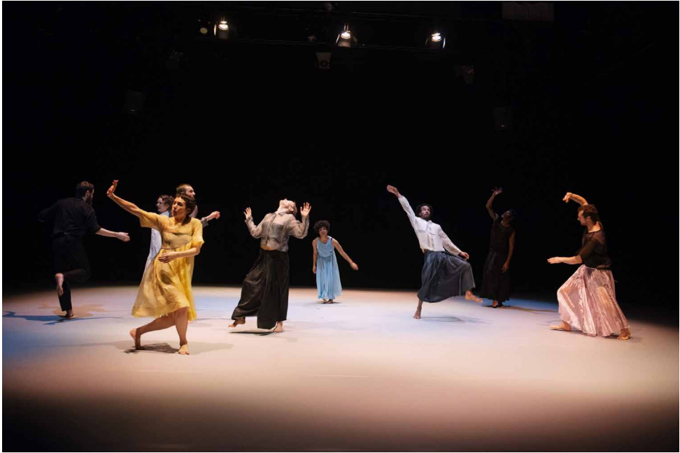
kunstencentrum BUDA – The Listeners, NEXT festival – Alma Söderberg & Cullberg